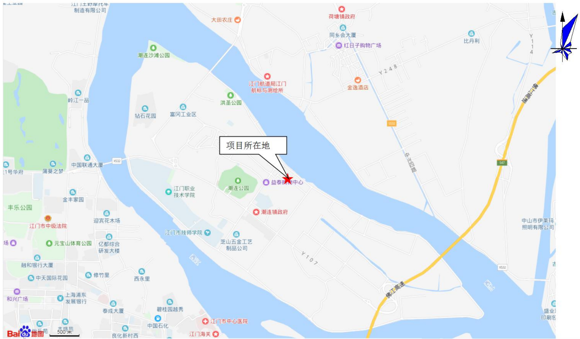
图1 项目地理位置图