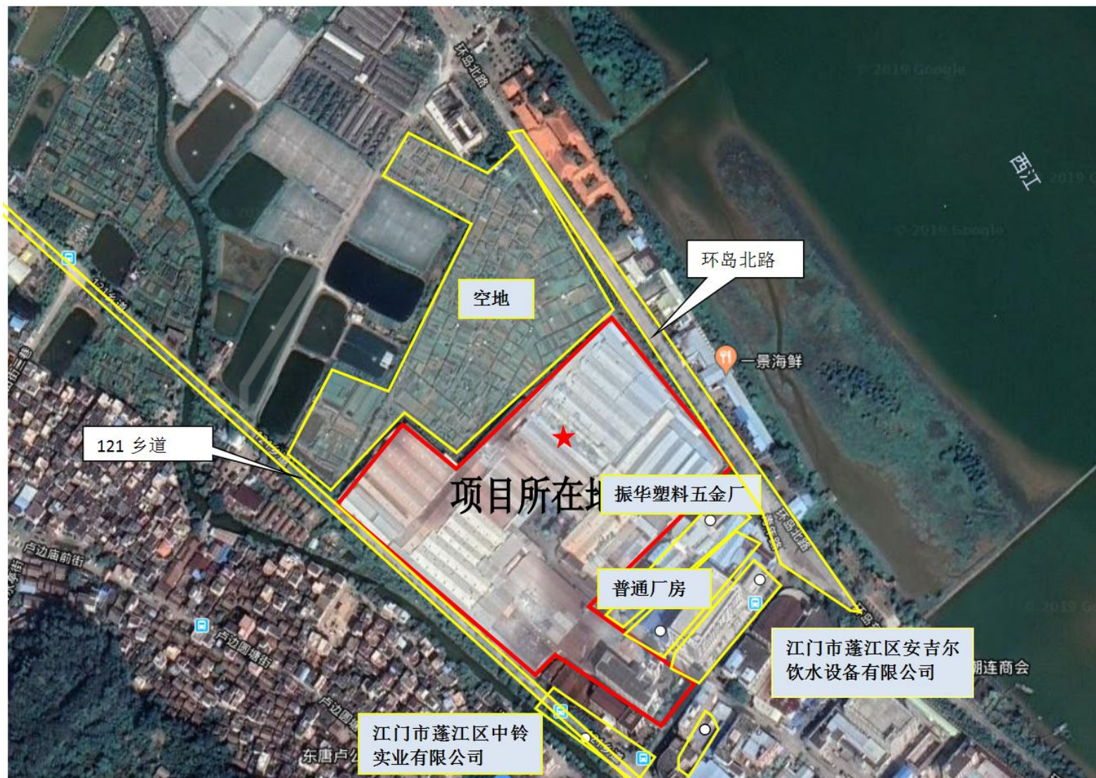
图 2 厂区四至图